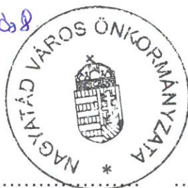
Nagyatád Város Önkormányzata Ormai István Polgármester